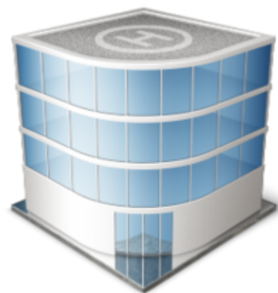
نماک ساختمان شرکت

شرکت [۱] یا کمپانی (به فرانسوی: Compagnie) به معنای یک شخصیت حقوقی انجمن یا بنگاه تجارت است. بنابر تعریف قانون مدنی ایران، کمپانی عبارت است از اجتماع حقوق مالکان متعدد در شیء واحد به نحو اشاعه، [۲] ولی این تعریف در برگرفته مشاعات نیز است. بنابر مفهومی که از قانون تجارت استنباط می‌شود، شرکت قراردادی است که بر اساس آن اعضا یا شرکا سود حاصل از سرمایه را تقسیم می‌کنند. [۳] شرکت‌ها در قوانین ایران شخصیت حقوقی دارند. [۴]