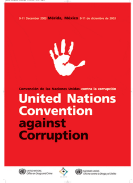
کنوانسیون ضد فساد سازمان ملل متحد UNCAC

یک معاهده چند جانبه بین کشورهای عضو است که در سال ۲۰۰۳ ارائه و سال ۲۰۰۵ به اجرا گذاشته شد. ۱۴۰ کشور از امضا کنندگان این عهد نامه هستند، که هدف از آن توافق بر تصویب و اجرای یکسری قوانین ضد فساد و توسعه روندهای مبارزه با فساد و همکاری‌های همه جانبه بین‌المللی در این زمینه‌ها است. مقصود اصلی UNCAC کاهش انواع فساد است که