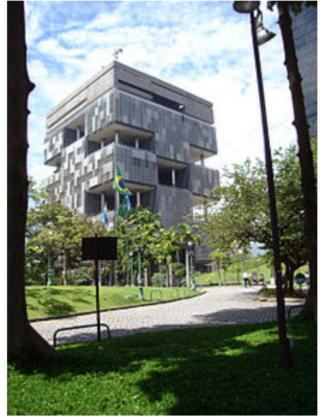
دفتر مرکزی شرکت پتروبراس - ریو دو ژانیرو

شرکت نفت برزیلی پتروبراس، یک شرکت نیمه ملی و چند ملیتی نفتی است که مقر مرکزی آن شهر ریو دو ژانیرو در برزیل می باشد. در سال ۲۰۱۶ این شرکت رتبه ۵۸ را در رده بندی فورچون جهانی ۵۰۰ به خود اختصاص داد. پتروبراس به اتهام تبانی بین شرکت های بزرگ و سیاستمداران و همچنین فساد، تحت تحقیقات قانونی قرار گرفته است.