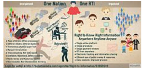
قانون حق دسترسی به اطلاعات در هند

«قانون حق دسترسی به اطلاعات» در سال ۲۰۰۵ در پارلمان هند به تصویب رسید. بنا به آن هر شهروند هندی می‌تواند از مسئولین دولتی و حکومتی کسب اطلاع بنماید و ایشان موظفند در کمتر از ۳۰ روز پاسخ بدهند. همچنین قانون، سازمان‌های دولتی و عمومی را موظف می‌سازد تا دسته‌های خاصی از اطلاعات را بمنظور سهولت دسترسی از طریق کامپیوتر و به‌طور الکترونیکی در اختیار شهر وندان بگذارد. فساد در هند مانند بسیاری ممالک در حال رشد دامنه گسترده‌ای دارد. نمونه‌های بسیاری از صدمات و ضررهای ناشی از فساد اداری وجود دارند، برای مثال؛ قشرهای فقیری در