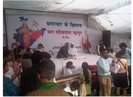
نهضت ضد فساد در هند

نهضت ضد فساد از سال ۲۰۱۱ با یکسری تظاهرات در سراسر هند به منظور مبارزه با فساد گسترده سیاستمداران آغاز شد. مجله تایم آن را یکی از ۱۰ داستان مهم رده‌بندی کرد. نهضت زمانی به طور جدی رشد کرد که انا هزاری Anna Hazare کنشگر ضد فساد اقدام به اعتصاب غذا در دهلی نو نمود. هدف اصلی این حرکت کاهش فساد سیاسی در رده‌های حکومت با تصویب قوانین بود. هدف دیگر شامل بازگرداندن دارایی‌های غیرقانونی افراد فاسد دولت و سیاستمداران از بانک‌های سوئیس می‌شد. این حرکت