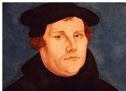
مارتین لوتر بنیانگذار پروتستانسیم