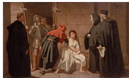
دادگاه تفتیش عقاید کلیسای کاتولیک

تاریخ مذهب شامل موارد متعددی می‌شود که رهبران مذهبی پیرامون وجود فساد در عملکرد مذهبی و سازمان‌های مذهبی هشدار داده‌اند. پیامبران یهودی اشعیا و عامویس دستگاه خاخامی ( حاخام ) پادشاهی