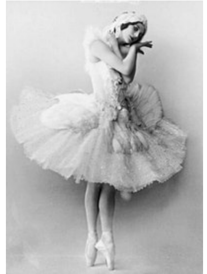
آنا پاولوا، رقصنده روس در باله مرگ قو

به کنشگران رقص رقصنده، و به خود کنش، رقصیدن یا رقص گفته می‌شود.