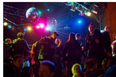
رقص فی البداهه فردی در کلوب شبانه رقص

رقص فی البداهه فردی به طور معمول حاصل وجد کنشگر است و در میانه جمع ولی به صورت انفرادی و عاری از هر محدودیت و قواعد تکنیکی اجراء می شود. هر کسی با توجه به استعداد شخصی، زبان حرکتی فردی و قدرت ابراز وجود در جمع و به صورت کاملاً فی البداهه و از پیش برنامه ریزی نشده به اجراء این نوع رقص می پردازد، به طور مثال: