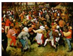
رقص عروسی، اثر پیتر بروگل