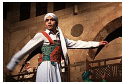
یک صوفی در رقص. نمونه‌ای از رقص عارفانه

هر نوعی از رقص که مدعی ورود و اتصال به عوالم روحانی یا ارتباط با ماوراءالطبیعه است. اساس و شالوده رقص عرفانی باورهای اعتقادی، مذهبی و دینی دیرینه است: