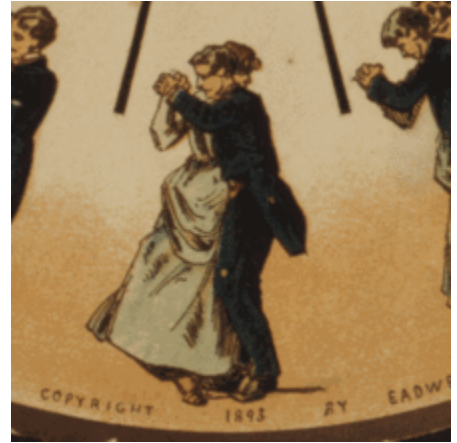
والس یک نوع رقص محلی

نوعی از رقص است که ریشه در فولکلور، عادات و سنن قومی و عشیره‌ای دارد. این نوع از رقص حاصل تداوم سنت بیان گروهی جامعه‌ای کوچک از مردمانی است که شادی و غم یا هر احساس دیگر مشترک جمعی را با زبان حرکت و ایماء و اشاره و در غالب حرکاتی موزون منتقل می‌کنند. رقص محلی در واقع راوی تجربه‌های جمعی عشایر و روستانشینان است. [۱] رقص‌های محلی و فولکلوریک در همه جوامع بشری یافت می‌شود و جزئی از میراث فرهنگی بشریت محسوب می‌شود.