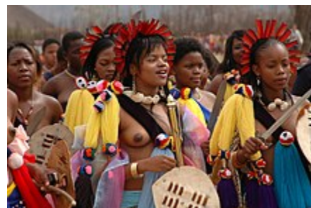
شاهزاده سیخانپیتسو (شاهزاده اسواتینی) در حال رقص در آیین اوملانگا