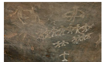
بسیست رقصنده به همراه نوازندگان. نقاشی صخره‌ای درون غار در نزدیکی بوهپال، هند، با ۱۲۰۰۰ سال قدمت.

بر خلاف برخی از فعالیت‌های انسان آغازین مانند ساخت ابزارهای سنگی، شکار، نقاشی در غار و غیره، رقص هیچ نوع جسم فیزیکی از خود به جای نمی‌گذارد؛ بنابراین صحبت کردن دربارهٔ زمان ورود رقص به فرهنگ بشر غیرممکن است. با