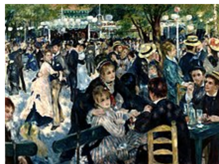
رقص در مولن دو لا گالت، اثر رنوار

گرچه رقص و موسیقی به دوران پیش از تاریخ برمی‌گردد، معلوم نیست که کدام یک «زودتر» به وجود آمده‌است ولی از آنجا که «ضرب‌آهنگ» و «صدا» در نتیجه حرکت ایجاد می‌شوند و موسیقی می‌تواند حرکت را القا کند، به نظر می‌رسد که رابطه این دو همواره به شکل همزیستی بوده‌است.