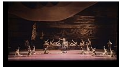
نمایش باله اسپارتاکوس. باله بولشوی مسکو. ۲۰۰۳

به نوعی از رقص اطلاق می‌شود که به وسیلهٔ افراد تمرین دیده به صورت حرفه‌ای و برای نمایش جمعی و عمومی در یک محیط نمایشی مانند سالن تئاتر اجراء می‌شود، مانند: