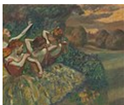
چهار رقص، اثر ادگار دگا