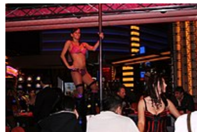
نگاره ای از یک رقصنده برهنه پای میز قمار در یک کازینو در شهر لاس وگاس در حال رقص میله ای.

به انواع مختلف رقص همچنین باید رقص های اصطلاحاً مبتذل را افزود که تنها با هدف ایجاد سرگرمی و اغلب با تحریکات شهوانی اجراء می شوند، مانند رقص «استریپ تیز» مرسوم در کلوب های شبانه در غرب، نوعی از رقص های کاباره ای که در فیلم های فارسی دهه چهل و پنجاه خورشیدی باب شد و نوعی از رقص های زنانه عربی.