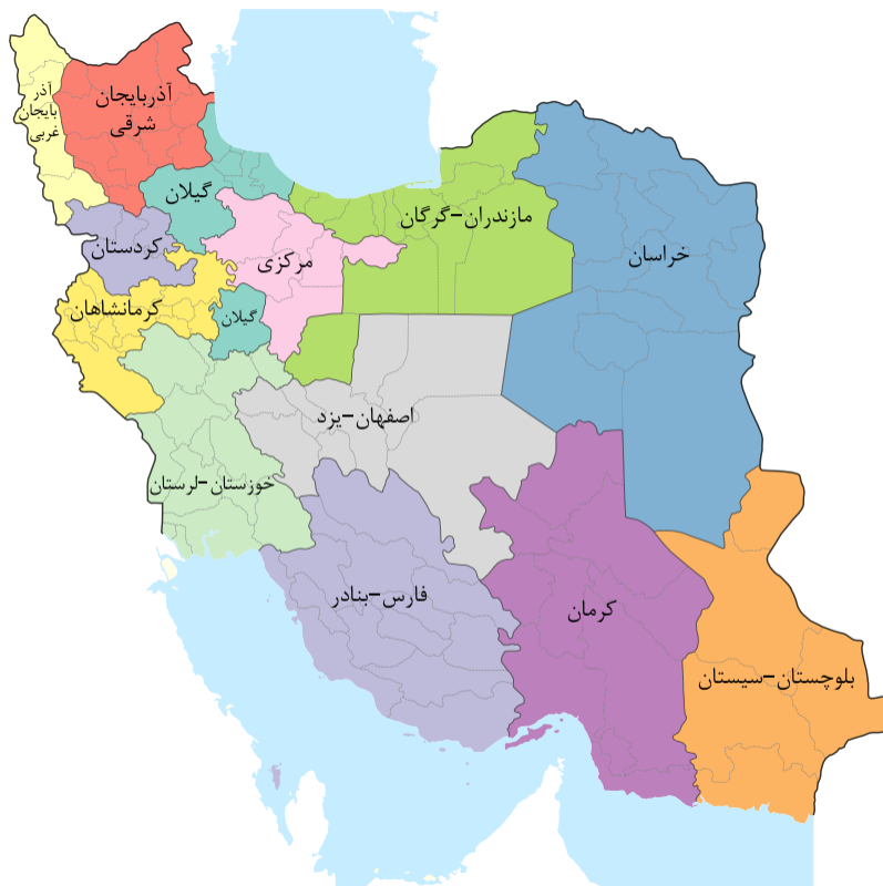
استان‌ها و شهرستان‌های ایران در ۱۳۲۵

از سال ۱۳۱۶ به بعد ب در تقسیمات کشوری به استناد تبصره ماده ۲ قانون سال ۱۳۱۶ به وجود می‌آید. در سال ۱۳۲۵ استان سوم و چهارم تبدیل به یک استان به نام استان آذربایجان گردیده و سال ۱۳۲۶ فرمانداری کل بلوچستان به مرکزیت زاهدان و ۳ فرمانداری تابعه تحت نظر یک نفر مأمور عالی‌رتبه به نام فرمانداری کل که هم‌ردیف با استاندار است اداره، و در سال ۱۳۲۶ علاوه بر تأسیس فرمانداری کل بلوچستان، استان مرکزی (به مرکزیت تهران) نیز در تاریخ ۲۰ مهر ۱۳۲۶ با ترکیب شهرستان‌های قزوین، ساوه، قم و دماوند و محلات ایجاد شد.