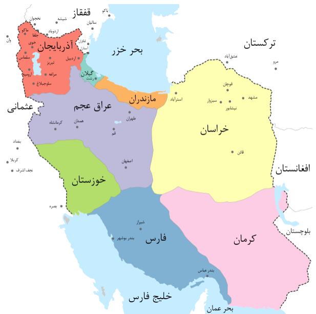
نقشه «ممالک محروسه ایران» چاپ مجله طنز ملانصرالدین به تاریخ ۱۳۲۶ هجری قمری (۱۹۰۸ میلادی)

در اوایل دوره قاجار ایران به پنج حکمرانی و دوازده حاکم‌نشین تقسیم می‌شد: