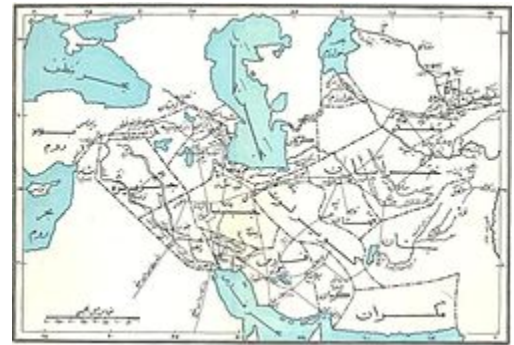
تقسیمات سیاسی ایران در زمان خلفای عباسی

تقسیم‌بندی قلمروی عباسی در قرن چهارم بدین شکل بود: