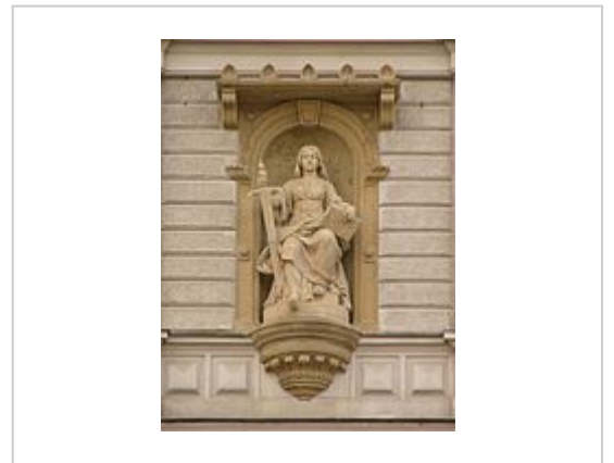
در جمهوری چک