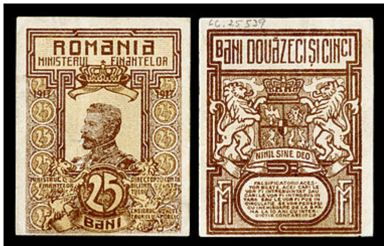
۲۵ بانی - (۳۹ × ۵۱ mm)

در بیشتر کشورهای دنیا پول در گردش دارای دو بخش پول مسکوک و پول بانکی است که پول بانکی اکثریت مقدار پول در گردش را تشکیل می‌دهد.