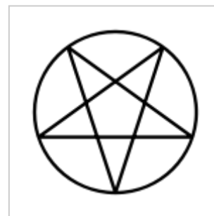
لوح هیکل، دستخط باب، لوگو آیین بیانی