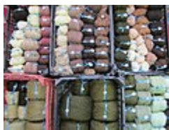
کلافهایی که برای بافت تابلو فرش، فرش، فرش و قالی بکار می‌روند