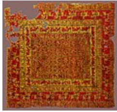
قالی پازیریک، قدیمی ترین فرش یافته شده در جهان