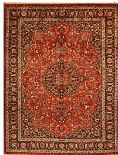
نمونه‌ای از فرش مشهد

قالی مشهد در کارگاه‌های این شهر و اطراف آن بافته می‌شود. این قالی از مرغوبیت چشمگیری برخوردار است و معمولاً به بازارهای غرب و انگلستان می‌رود. نقش‌های به‌کاررفته در آن‌ها نقش‌های ترنج، اسلیمی و پیچک مانند هستند. [۸]