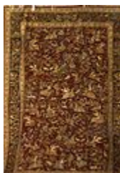
طرح فرش درختی