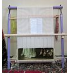
دار قالی، مخصوص بافت تابلو فرش