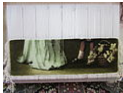
بافت تابلو فرش در مراحل ابتدایی