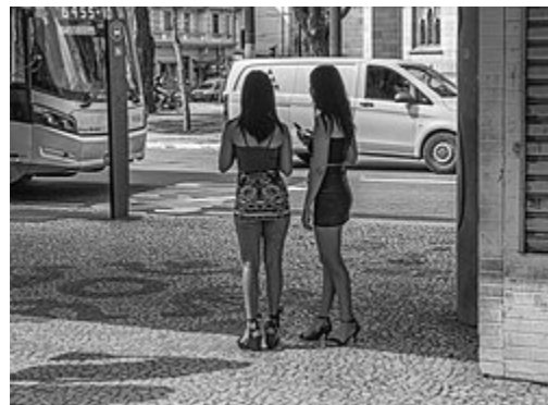
تصویری از روسپیان خیابانی در حال انتظار برای پیدا کردن مشتری.