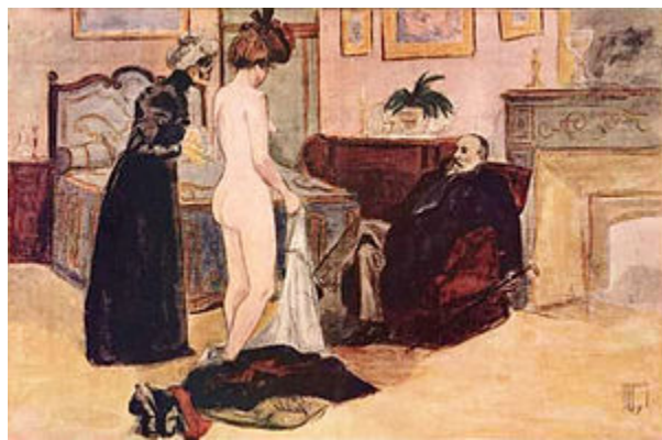
یک روسپی در اثری از هرمان ووگل به سال ۱۸۵۶ میلادی