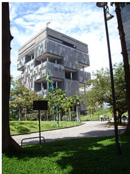
دفتر مرکزی شرکت پتروبراس - ریو دو ژانیرو

نفع ان شرکت‌ها عمل می‌کنند. ممکن است که بعضی رفتارهای منفی شرکت‌ها ضرورتاً در همه جا جنایی تلقی نشوند، قوانین در جوامع مختلف متفاوت هستند.