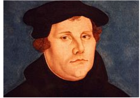
مارتین لوتر بنیانگذار پروتستانسیم

البته سر دامداران سرمایه داری از گذشته همواره سعی داشته‌اند تا با استفاده از مذهب خود را مقبول و درست معرفی کنند. سازمان‌های خیریه نظیر Spiritual Mobilization یا آن‌هایی که سوپ و خوراکی توزیع می‌کنند، سعی دارند سرمایه‌داری و مسیحیت را در اذهان با هم ادغام نمایند، و در عین حال کمک‌های اجتماعی دولت به نیازمندان را به بی‌خدایی و بت‌پرستی ربط می‌دهند. [۳۷]